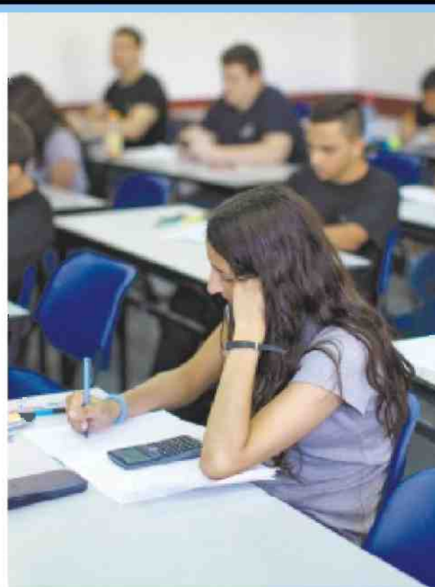
בגרות במתמטיקה בבית ספר בחולון, בשנה שעברה

אחרי הרשויות החרדיות, הנמצאות בתחתית הרשימה, נמצאות בהפרש די גדול רשויות ערביות